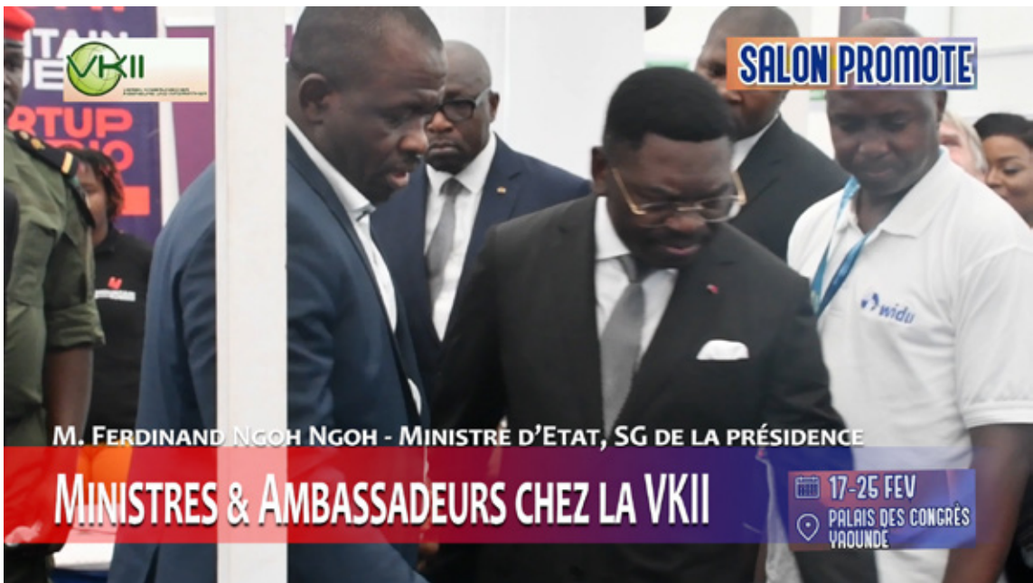
M. FERDINAND NGOH NGOH - MINISTRE D'ETAT, SG DE LA PRÉSIDENTE